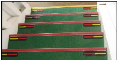
弱視者への配慮も (弱視者対応色付階段)