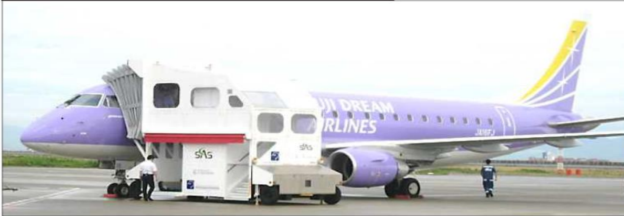
昇降用エレベーター全体図・使用方法