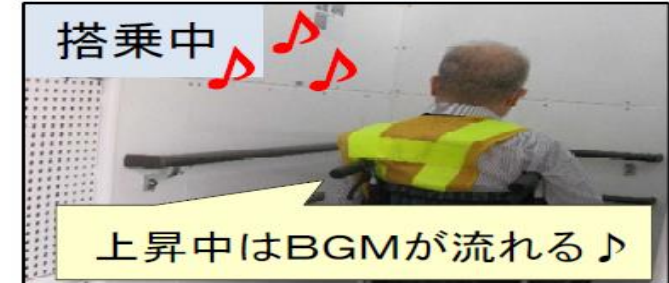
上昇中はBGMが流れる♪