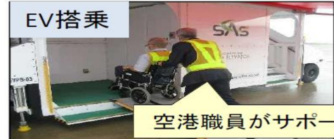
空港職員がサポート